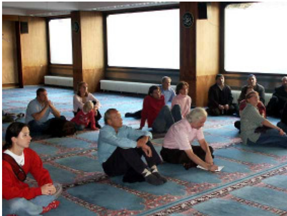
Besuch eines Grazer muslimischen Gebetsraumes

Es gibt aktuell einen Diskurs über den Islam, der sich meist an den Reizwörtern Minarett und Kopftuch entzündet. Gerade im Bild von türkischstämmigen MitbürgerInnen überlagern sich dabei ausländerfeindliche und islamophobe Ansichten.