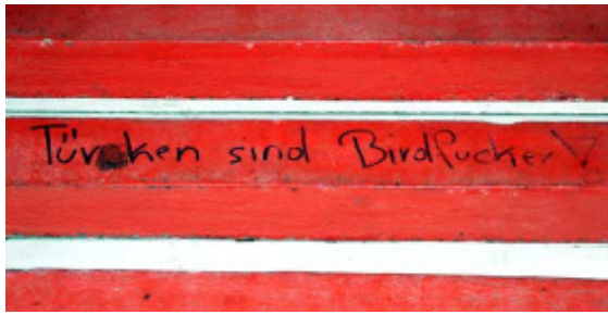
rassistisches Graffiti im Grazer Augarten

Viele von ihnen sind aufgrund ihrer Herkunft oder Religion von Vorurteilen betroffen, ein nicht geringer Anteil hat am Arbeitsplatz, bei Ämtern oder in der Öffentlichkeit sogar mit Diskriminierungen zu kämpfen.