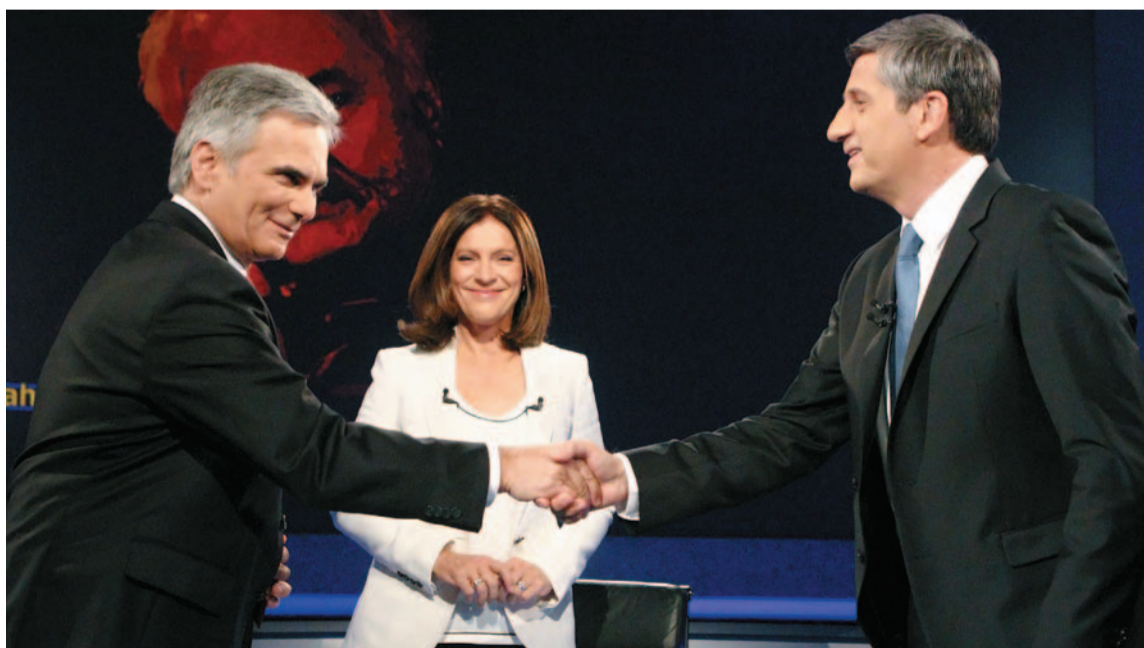
Werner Faymann, Ingrid Thurnher in Michael Spindelegger na televizijskem soočenju 24. septembra letos